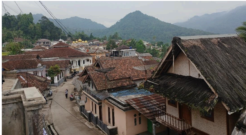
Gambar 2. Suasana Kampung Adat Cisungsang

memanfaatkan sumber daya hutan, terutama hasil hutan non-kayu dan keanekaragaman hayati yang berkontribusi terhadap ketahanan pangan dan keberlanjutan ekosistem lokal. Pengelolaan sumber daya tersebut dilandaskan pada prinsip keberlanjutan yang berakar pada kearifan lokal, dengan menekankan keseimbangan antara kebutuhan manusia dan kelestarian alam. Namun demikian, perubahan kebijakan pemerintah serta praktik eksploitasi yang tidak terkendali berpotensi mengganggu tatanan ekologis yang selama ini dijaga oleh masyarakat adat.