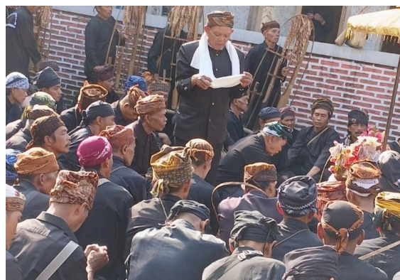
Gambar 6. Peran Sesepuh dalam Ritual Adat

Dalam konteks politik lokal, pemimpin adat juga berperan sebagai mediator antara masyarakat dan negara. Mereka terlibat dalam proses negosiasi dengan pemerintah dan pihak eksternal untuk memastikan bahwa hak-hak adat terlindungi dan aspirasi komunitas tersampaikan dengan tepat (Firmansyah & Nurrochmat, 2018). Fleksibilitas politik ini menunjukkan kemampuan kepemimpinan adat dalam memperkuat identitas kolektif di tengah tekanan dari luar. Sistem kepercayaan yang dianut masyarakat Kasepuhan Cisungsang menjadi unsur penting dalam membangun kesatuan sosial. Keyakinan terhadap adat dan leluhur membentuk landasan norma dan tindakan sosial, di mana setiap keputusan lembaga adat memiliki kekuatan simbolik dan moral yang tinggi sehingga dipatuhi oleh masyarakat (Fadrullah & Syam, 2024; Molebila et al., 2023). Nilai-nilai seperti gotong royong, penghormatan terhadap alam, dan tanggung jawab kolektif tidak hanya diajarkan, tetapi juga dipraktikkan secara langsung dalam kehidupan sosial dan ritual, yang pada akhirnya memperkuat solidaritas dan rasa memiliki dalam komunitas. Keseluruhan struktur sosial, kepemimpinan adat, dan sistem kepercayaan tersebut menjadi pilar utama dalam pembentukan serta pelestarian identitas kolektif masyarakat Kasepuhan Adat Cisungsang yang terus dikonstruksi secara dinamis di tengah perubahan zaman.