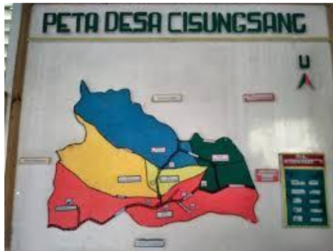
Gambar 1. Peta Wilayah Kasepuhan Cisungsang